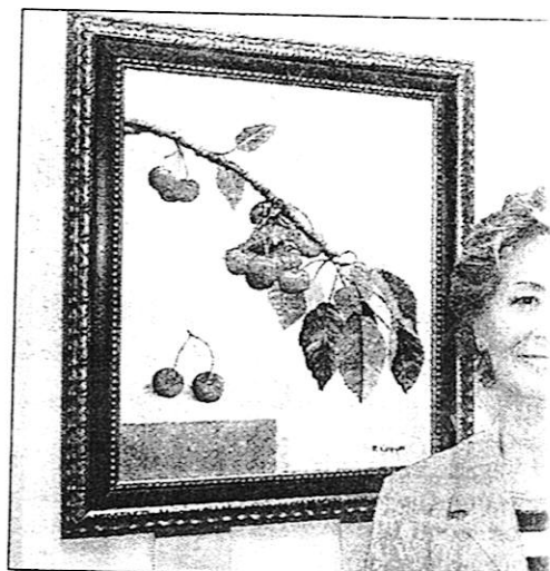
Una atmósfera de sensibilidad envuelve la interpe

"Soy de Madrid pero me casé con un coruñés y, bueno, los gallegos to-